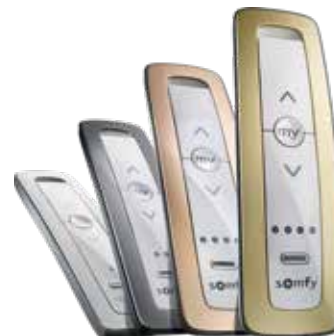
Gama de colores disponibles: Pure, Silver, Rose Gold, Gold

Compatible con todos los motores con Radiotecnología Somfy (RTS) integrada.