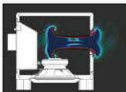
HS8S (MODELO NUEVO)